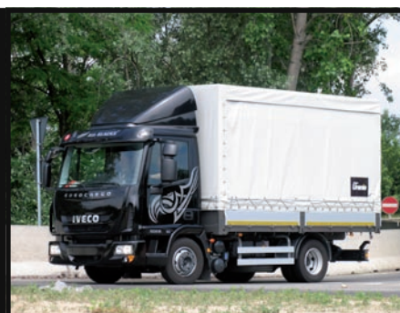
10-tonowa, niewielka, uniwersalna ciężarówka z plandeką. Ale pod kabiną 180 KM.

Zmiany zaszły też w układach napędowych. Nowe Eurocargo będą otrzymywały zmodernizowane silniki z dobrze znanej i cenionej za osiągi, trwałość i niskie zużycie paliwa rodziny Tector. Zostały one opracowane i są produkowane przez siostrzaną firmę, Fiat Power Train (FPT), jak wskazuje nazwa też należąca do Grupy Fiat. Uwagę zwracają niezależnie od typu silnika szerokie zakresy obrotów, w jakich oddają one do dyspozycji kierowcy maksymalne momenty obrotowe. W zależności od wersji samochodu będą to silniki cztero- lub sześciocyldrowe. Pierwsze mają pojemność 3,9 l i osiągają maksymalne moce i momenty obrotowe odpowiednio: 140 KM i 465 Nm przy 1200-2100 obr./min; 160