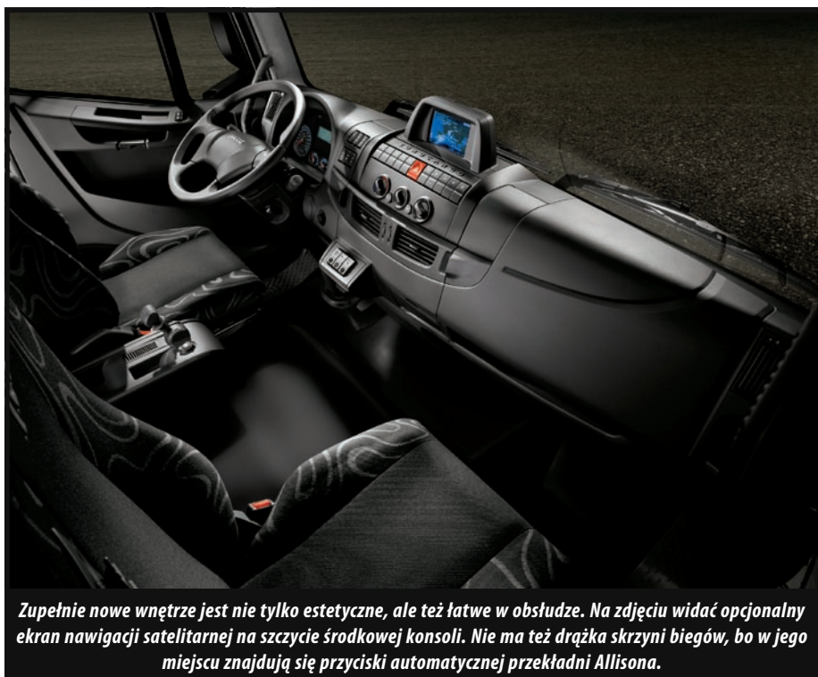
Zupełnie nowe wnętrze jest nie tylko estetyczne, ale też łatwe w obsłudze. Na zdjęciu widać opcjonalny ekran nawigacji satelitarnej na szczycie środkowej konsoli. Nie ma też drążka skrzyni biegów, bo w jego miejscu znajdują się przyciski automatycznej przekładni Allisona.

czy, że Iveco dobrze rozumie potrzeby rynku i zamierza oferować go takim użytkownikom, jak firmy budowlane czy remontowe korzystające z lekkich ciężarówek zarówno do przewozu ludzi i sprzętu np. na plac budowy. Le nie tylko. Trzeba pamiętać, że takimi pojazdami żywotnie zainteresowani są również inni odbiorcy, np. strażacy.