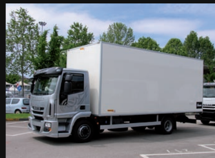
Krótka, niska, dzienna kabina i długie podwozie – takie auta często kupowane są pod zabudowy izotermiczne. Na zdjęciu wersja o dmc 12 t.