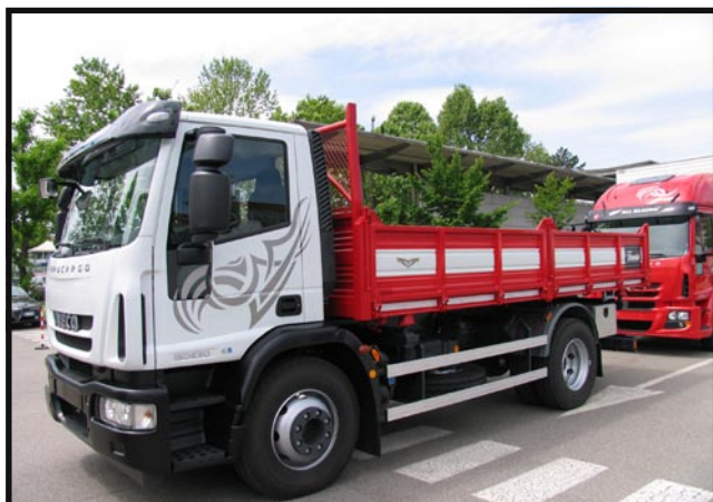
15 t dmc, prawie 300 KM, 22,5-calowe koła i trójstronna wywrotka – to już nie żarty. Ale to wciąż Eurocargo.

liwych związków w spalinach Euro 5, który zacznie obowiązywać dopiero od października 2009 roku. Przestrzeganie tych reżimów ekologicznych zapewnia zastosowanie technologii selektywnej redukcji katalitycznej (SCR).