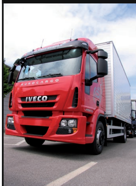
Podwyższona, długa kabina sypialna umożliwia stworzenie z Eurocargo pojazdu dalekodystansowego. Może nie na międzynarodowe trasy, ale nawet na parodniowe, krajowe, dla jednego kierowcy komfortu wystarczy. To wersja o dmc 16 t.

KM i 535 Nm od 1200 do 2100 obr./min oraz 180 KM i 610 Nm od 1300 do 2100 obr./min. Sześciocyldrowce to: 217 KM i 680 Nm od 1200 do 2250 obr./min; 252 KM i 850 Nm od 1250 do 2280 obr./min; 279 KM i 950 Nm od 1250 do 2050 obr./min oraz 299 KM i 1050 Nm od 1250 do 1900 obr./min. Wszystkie te jednostki spełniają Euro 4, ale na życzenie są też już dostępne w standardzie emisji szkod-